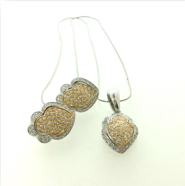
698892-07 lotto 2 Prezzo base €700,00