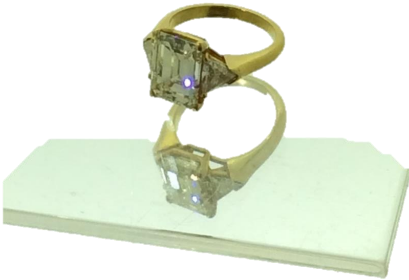
687442-03 Prezzo base €10.000,00