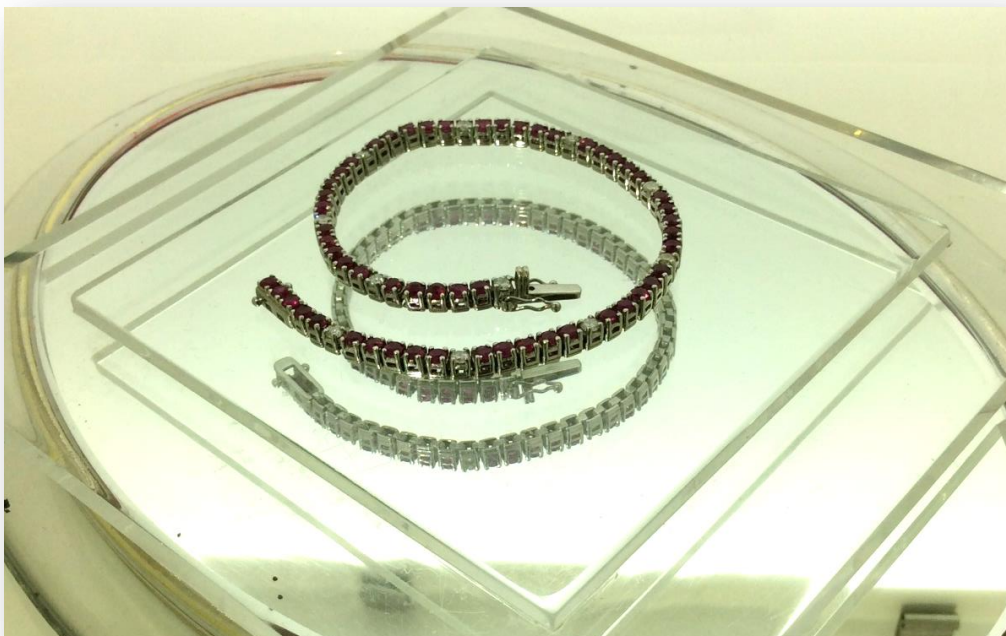
692989-21 lotto 2 Prezzo base € 300,00