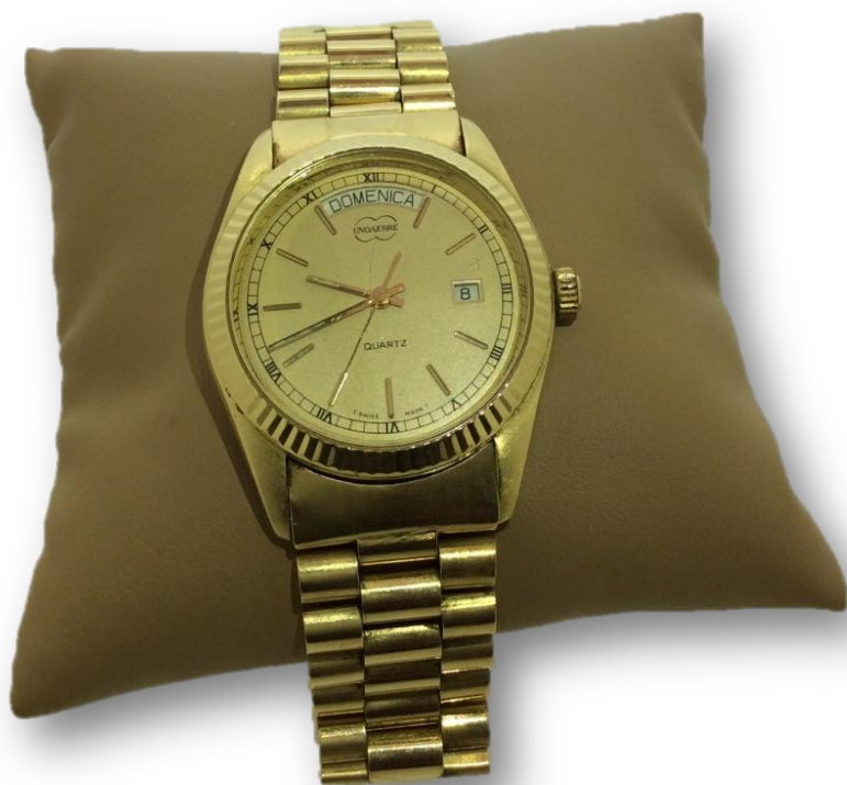
683671-15 lotto 1 Prezzo base €1800,00