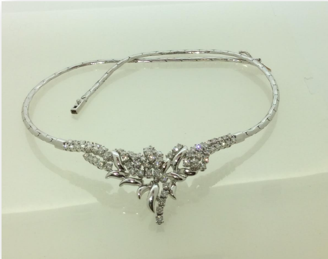
709991-48 lotto 3 Prezzo base € 1800,00