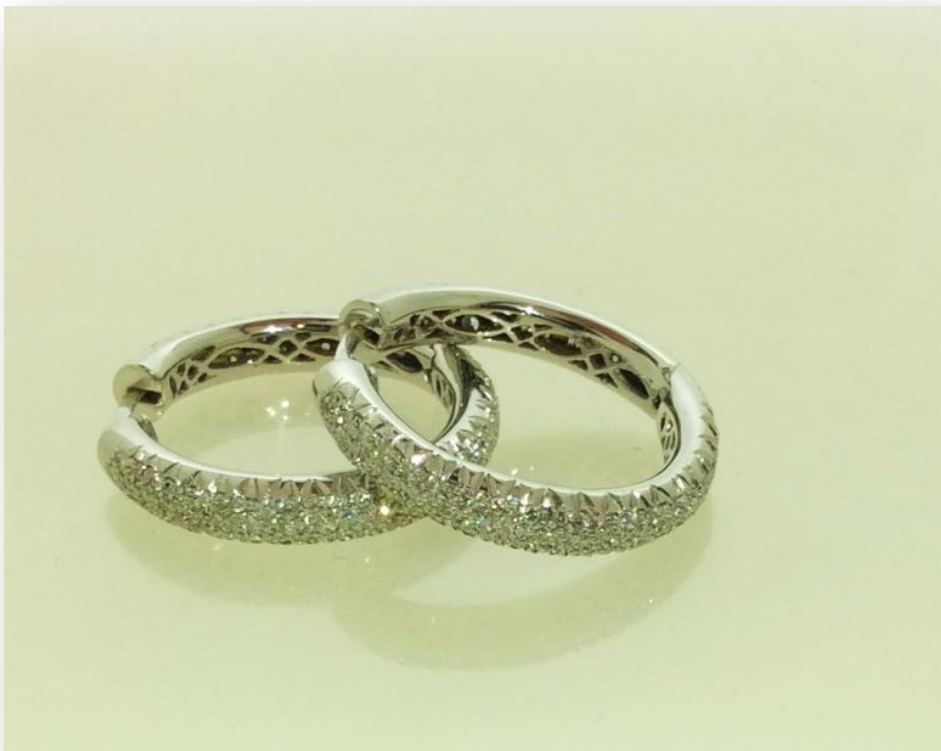
699572-08 lotto 4 Prezzo base € 650,00