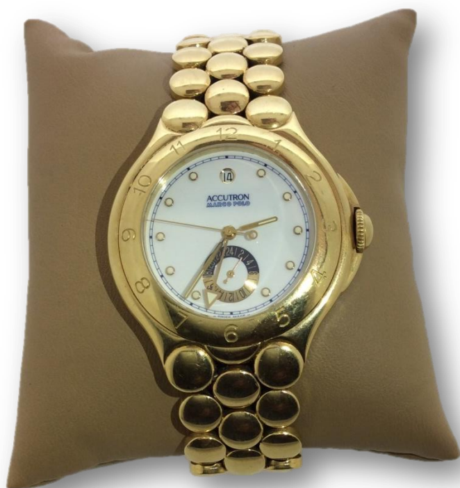
683671-15 lotto 2 Prezzo base € 3300,00